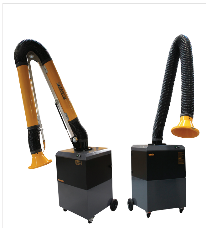
GeoGo mit ASA-4 Arm, ESA-Arm und WING-Arm