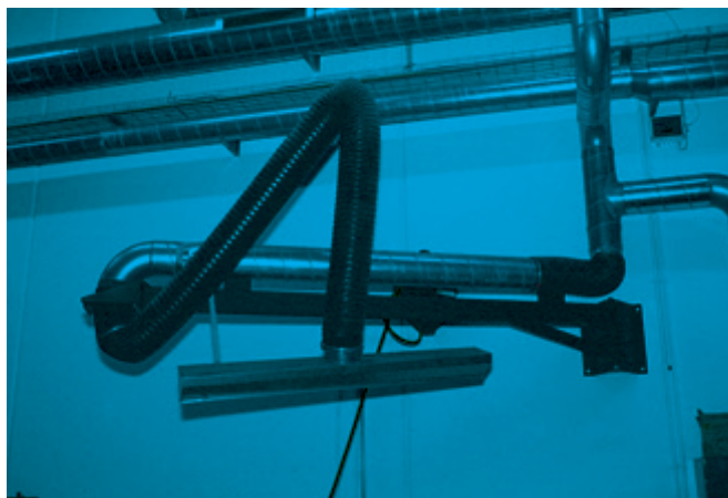
Spaltetragt – monteret med vægkonsol og tilslutning