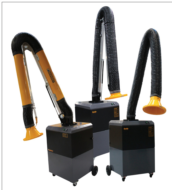
GeoGo vist med ASA-4 arm, ESA arm og WING arm