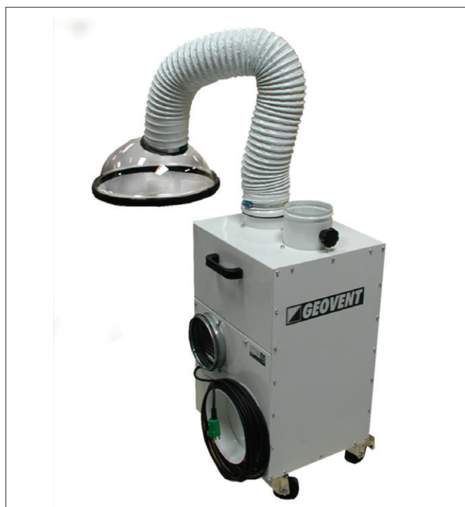
MVF-125-1 - Rückansicht

Sehr leicht zu Transportieren und von einem Van runterzuheben. Gewicht 50 kg.