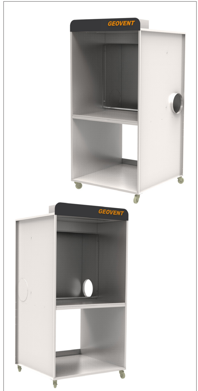
Spritzkabine für kleinere Werkstücke